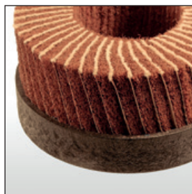
Tellerbürste – Schleifvlies Kombi