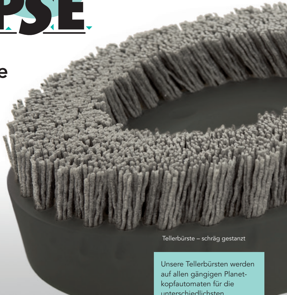
Tellerbürste – schräg gestanzt

Das bedeutet für Sie ein sehr gutes Preis-Leistungs-Verhältnis