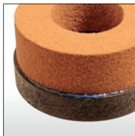
Tellerbürste – Schleifvlies geschäumt SVG – Typ 1