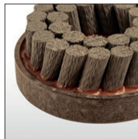
Tellerbürste – Typ-K schräg geklebt