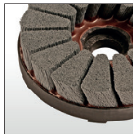
Tellerbürste – Typ-K Segment